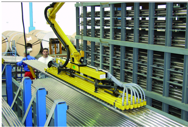
Ventouses à soufflets FSGB pour la manipulation des tubes